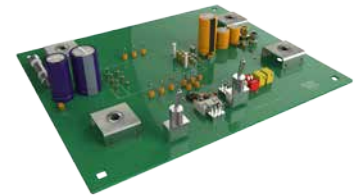
非隔离： 演示板配备两个 LGA80D 模块，可测试独立通道和模块堆叠运行。