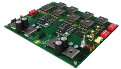
隔离： 单个演示板可以与所有三个隔离模块配合使用。